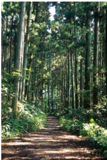
杉林の中の森戸林道

三浦アルプスのなかで、もっともポピュラーなコース。それだけによく整備され、初心者でも手軽に歩くことができる。京浜急行の新逗子駅から車道をたどり森戸林道のゲートへ。森戸川沿いの快適な樹林を森戸林道終点へ向かう。林道終点から沢をつめ、稜線に出る。すぐに分岐があり、左に入れば展望台のある上二子山だ。山頂をあとに分岐に戻り砲台道に入る。下った先の南郷上ノ山公園から車道をたどり新逗子駅へ戻る。歩き足りない人は京急田浦駅や、神武寺駅へ向かうとよいだろう。