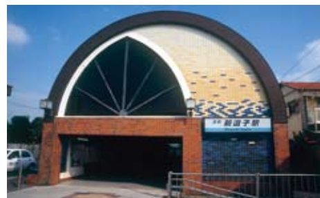
▲コースの起点となる新逗子駅

新逗子駅 → 森戸林道 → 東尾根 → 馬頭観音 → JR東逗子駅 → 神武寺駅