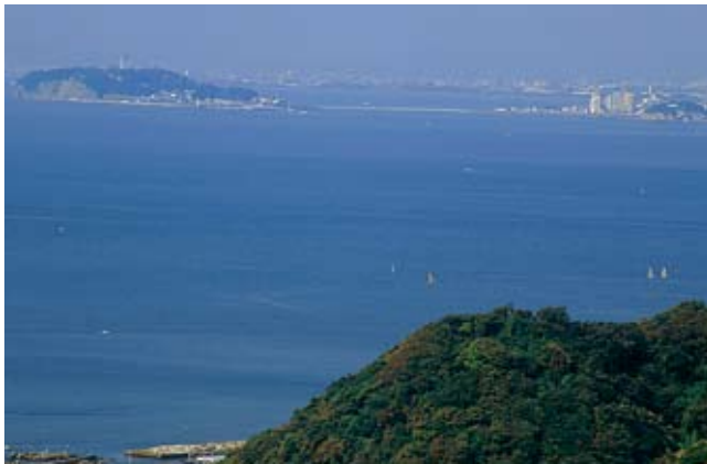
仙元山からの相模湾。左に江の島が見える