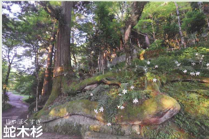
じゃぼくすぎ 蛇木杉

【蛇木杉】 広小路より奇岩怪石を見ながら登ってきて、急な二十七段の石段を上り終わったところに、蛇木杉がそびえたっています。この蛇木杉の樹齢は400年以上と言われ、樹の太さは6.3mあり、石老山中、最大の杉です。杉の根、二本が地上に露出しており、その姿は蛇が横たわっているように見えるところから蛇木杉と名付けられました。また、二本の根を雄龍、雌龍と言い、この龍がすぐ上にある鐘楼に登らんとする姿は、雄大であり、神秘的。