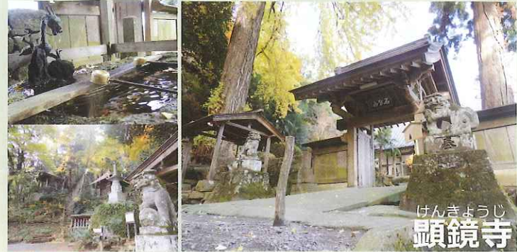
けんきょうじ 顕鏡寺

【顕鏡寺】 本尊は虫封じのお寺として古くから参拝客で賑わっています。境内には蛇木杉や大イチヨウ(かながわの名木100選)など古木が多くあります。