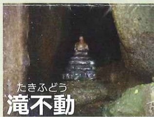
たきふどう 滝不動

【滝不動と屏風岩】 石だたみを利用した石段を上げれば樹木が繁茂するところに岩が重なり合った岩屋がありその中には不動明王が安置されています。岩屋の前の大石の上に蛇龍の石像があり、その上から落ちる滝がふりかかるところ