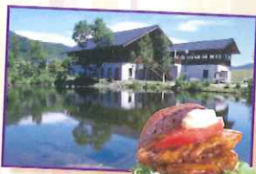
大人気！山賊ダブルバーガー！

高さ 8m のスタート地点から、一気に池を渡るスリル満点のアトラクションです。簡単な講習でどなたでも楽しめます！