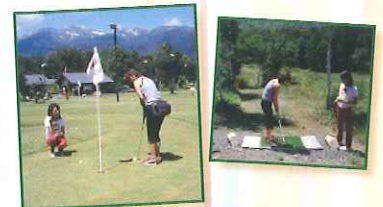
パター・マレットゴルフ

レストラン「シヨン」乗鞍岳の大パノラマを望むレストラン。人気の山賊バーガーとドリンクでひと休み。