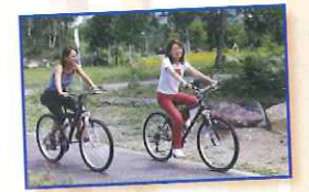
レンタルサイクル

高原のサイクリングコースを風きる自転車。一の瀬園地や鈴蘭方面への周遊コースなどがオススメ。