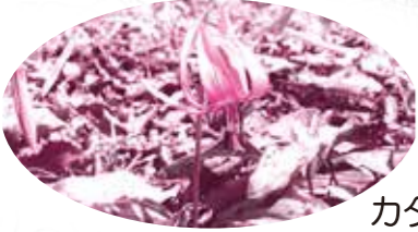
カタクリ(3月下旬~4月中旬)