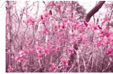
トウゴクミツバツツジ (4月上旬~下旬)