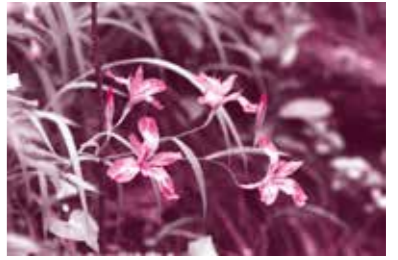
ヒメシヤガ (4月下旬~5月中旬)