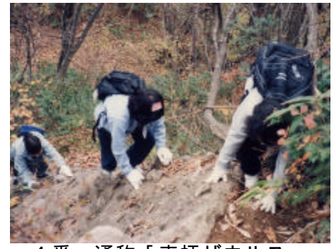
4番 通称「来拝ザウルス」