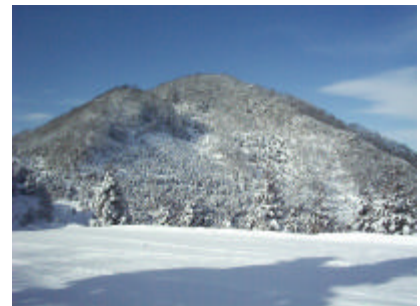
冬の来拝山：城前峠から