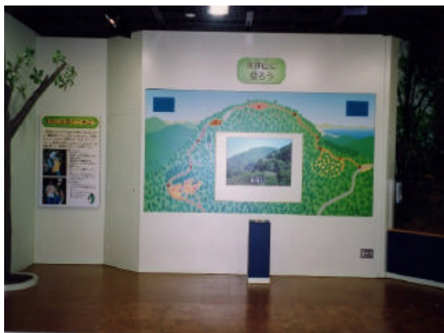
登山紹介ビデオ資料コーナー

エコスクール館地階には、来拝山の自然について学ぶことができる展示室があります。映像のコーナーでは、来拝山の登山コースを実際に歩きながら自然やコースを紹介する番組（約16分）が見られます。また、パネルで来拝山についていろいろ学ぶことができ、環境の大切さについても考えられるようになっています。来拝山登山の前か後に、ぜひ見てください。