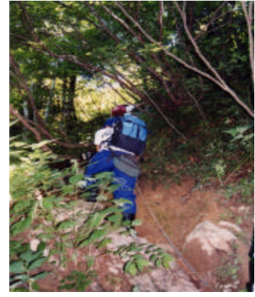
ロープ 3番 周辺