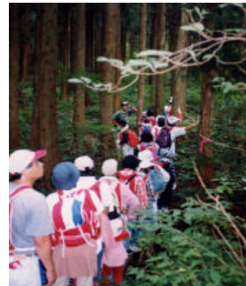
最初は杉林 1番周辺