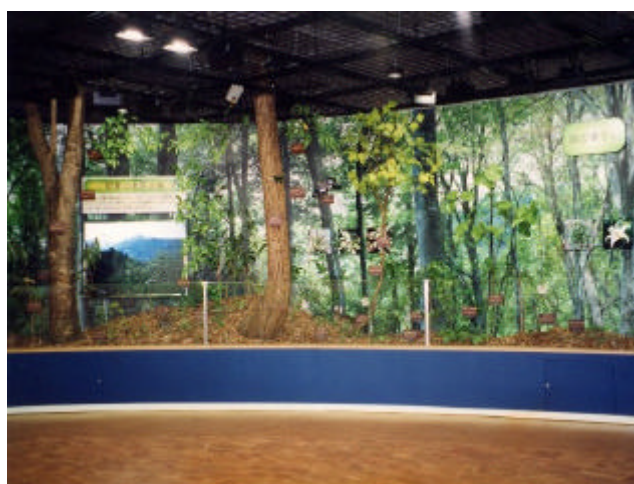
来拝周辺の自然のジオラマ