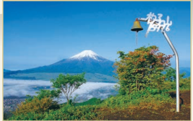
杓子山からのパノラマ

山頂では、富士山をはじめ、三ツ峠から南アルプス、そして山中湖の彼方に相模湾まで望む、360度の大パノラマが展開する「杓子山」登山。温泉旅館「不動湯」の脇を通り、およそ1500万年前海底だった地層が地上に露出している、ダイナミックな景観を眺めながら進む「古屋川」沿いのルートと、大きく裾野を広げる富士山を眺めながらの、険しくも爽快な登山道、「鳥居地峠」ルートという、2つの魅力を楽しむことができます。