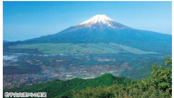
杓子山山頂からの展望