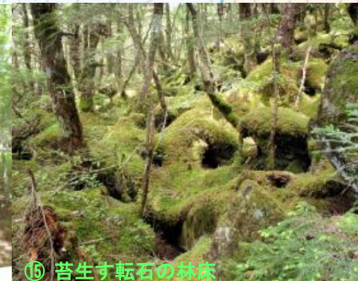
⑨ 苔生す転石の林床