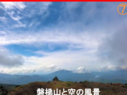
磐梯山と空の風景

箕輪山 平成28年10月13日 9:35→13:50 4:15 曇時々晴 強風寒い 自宅から直行 同行者 娘 野地温泉(内湯3 露天男2女3サウナ1 日帰り10:00~14:00 800円) 猪苗代町 福島市 docomo 通じる 登山者 11人(平日)