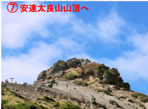
⑦ 安達太良山山頂へ