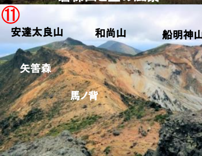
安達太良山 和尚山 船明神山 矢筈森 馬ノ背