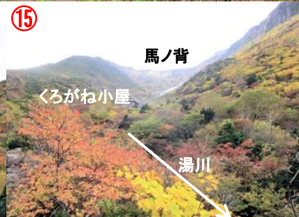
くろがね小屋 湯川