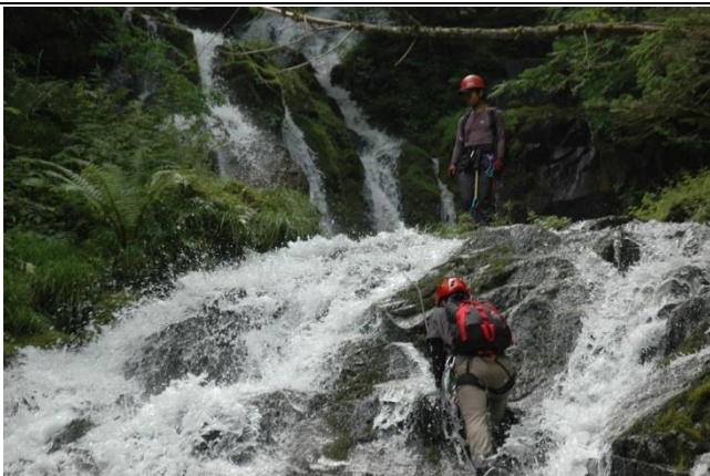
人気も高まっている沢登りも山ジャンルの一つ 釣行と組み合わせも良い。写真は比較的易しい焼山沢