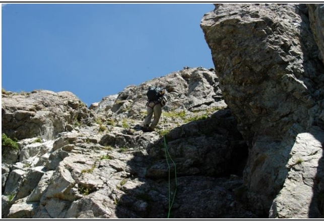
ロープワークやクライミング技術習得で幅も広がる より安全に楽しむ上で応急手当と共に身に付けておきたい