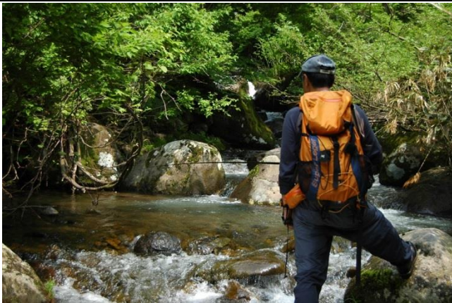
時には奥深い山の中へ入る溪流釣りも山の楽しみ こんな所まで！驚くほど奥地まで魚は棲む。溪や瀬も様々