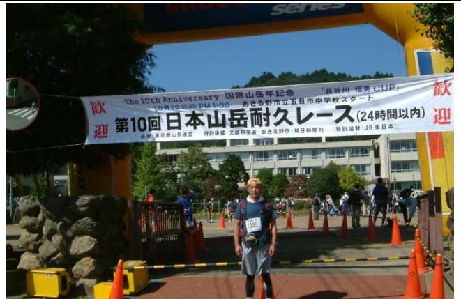
奥多摩で行われる日本山岳耐久レース（通称ハセツネ） 15年前のこの年にトランスジャパンアルプスレースも発足