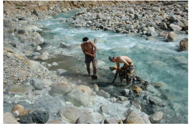
自分で湯船を作って入る湯俣温泉。源泉で温泉たまごも可 何れも歩いてしか行けない山の中の秘湯