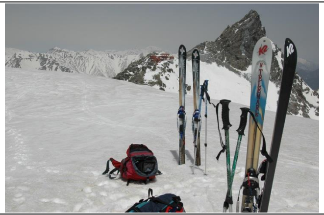
大自然の中を滑るバックカントリースキー 近年は安易な入山や遭難も問題になっている。大喰岳にて