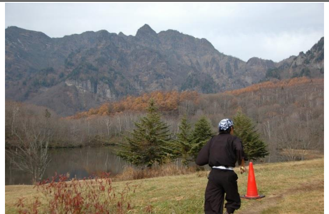
山を走るトレイルランニングも近年では人気 鏡池を忍者に仮装したランナーが走る。第1回戸隠大会