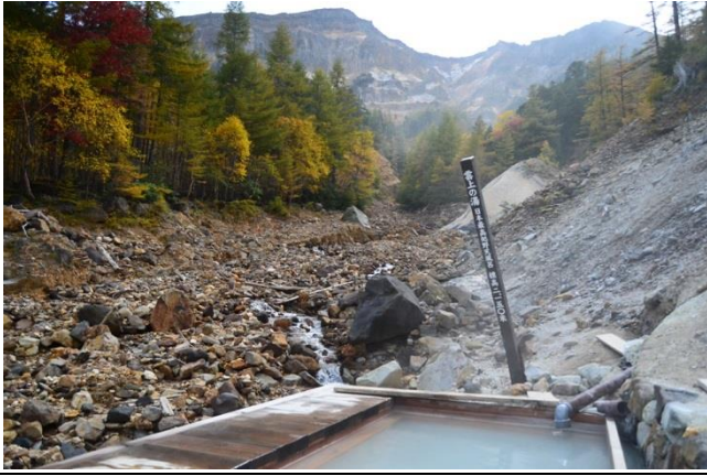
山の中に湧く温泉も山の楽しみの一つ 通年営業では日本最高所ハヶ岳本沢温泉。内湯は源泉が別