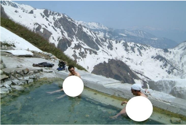
白馬鑓温泉。東方面に開け、日の出時の入浴にも定評あり 夏は山小屋が立ち、残雪期は自由に入れる。雪崩に注意