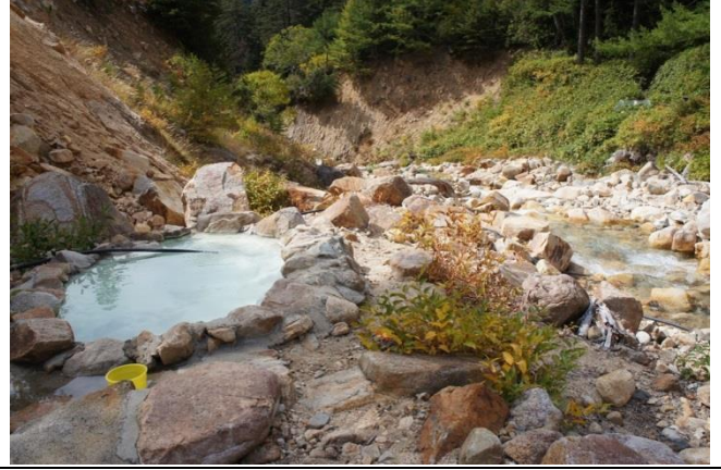
高天原温泉は北アルプス屈指の秘湯 通常、到着に3日掛かると言われる（超健脚なら日帰りも）