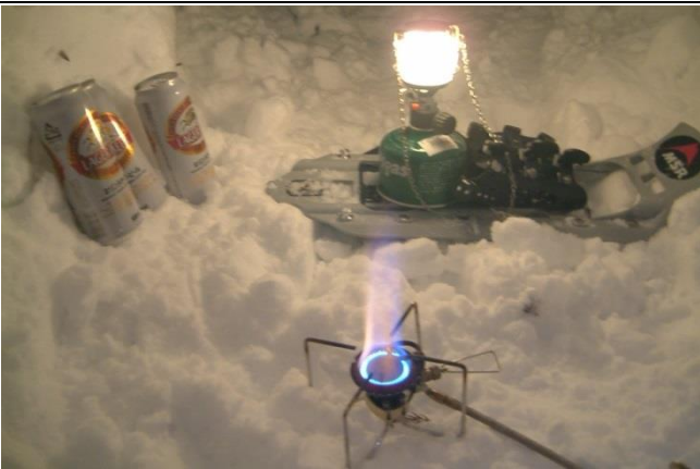
かまぐらを作って泊まる スノーシューハイキングも楽しい。戸隠奥社にて