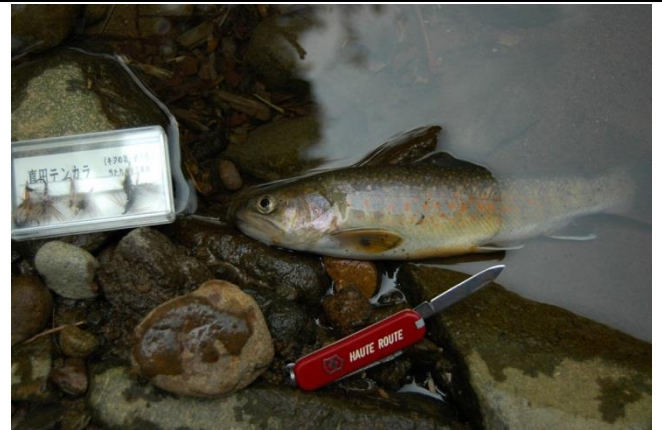
釣ったイワナをその場で焚き火しての塩焼きも最高 （その写真を載せたいが、写りの悪い昔の写真しか無く）