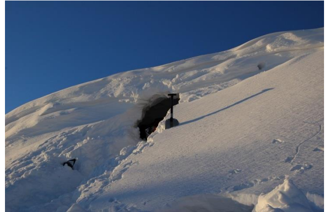
雪を掘って作る雪洞泊も楽しい。内部は意外と寒くなく、 どんなに吹雪いてもへっちゃら。写真は根子岳