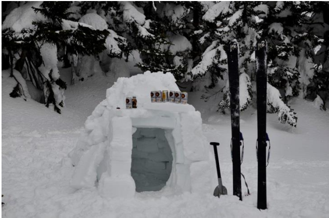
雪ブロックを積み上げて作るイグルー 即席のエスキモーハウスのようなもの