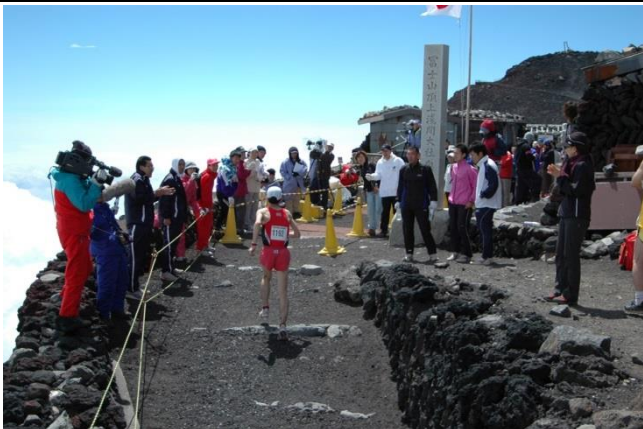
日本屈指の完走難度を誇る富士登山競走は山頂がゴール 今年で69回目と歴史ある大会。最近では異様に人気も高い