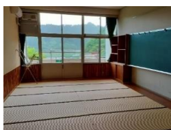
「部屋 男女別の相部屋」