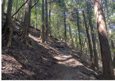
山頂直下、杉林の奥に広葉樹が見える