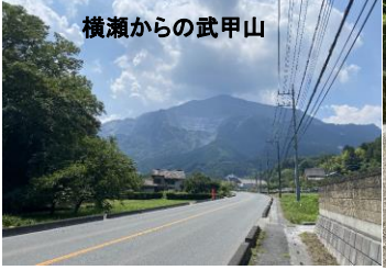
横瀬からの武甲山