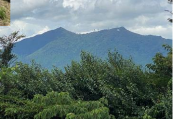
宝鏡山頂からの筑波山先週は、向こうから宝鏡山を眺めた