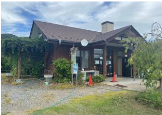
↑小田休憩所 ↓小滝帯をいく