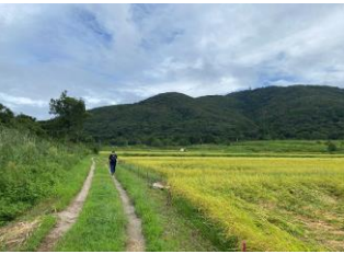
↑稲刈りが始まっていた