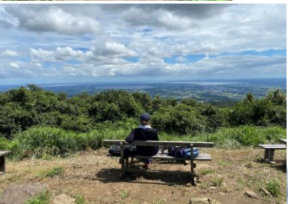
宝鏡山 山頂ベンチ、いつもこのベンチ。眼下は霞ヶ浦