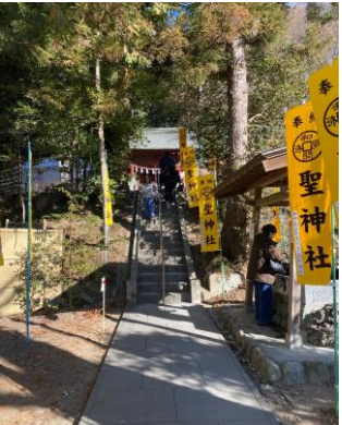
聖神社で登山の安全祈願