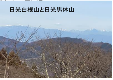
日光白根山と日光男体山