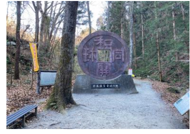
和銅開珠のモニュメント