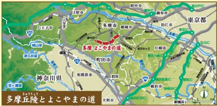
多摩丘陵とよこやまの道