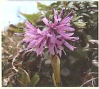
シヨウジョウバカマ