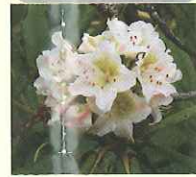
ハクサンシャクナゲ