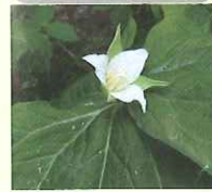
シロバナエンレイソウ