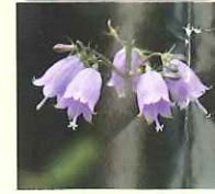
ツリガネニンジン