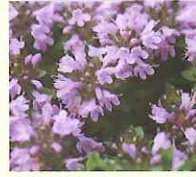
イブキジャコウソウ