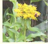
ホソバノキリンソウ