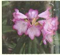
アズマシャクナゲ