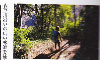
森戸川沿いの広い林道を経由して中尾根へ。中尾根はヤセ尾根なので注意して歩こう。