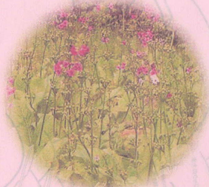
クリンソウ(九輪草) サクラソウ科

山間部のやや湿ったところに生えています。大きな根性葉から30センチくらいの花茎を出し、濃い赤紫の花を車輪状につけます。それが数段に重なる姿が仏閣などの屋根にある「九輪」に似ていることが名前の由来となっています。