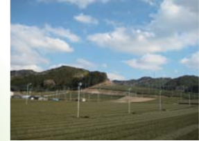
1 法多坂下バス停周辺から南側の茶畑を見る