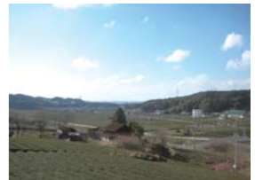
4 長坂トンネルを過ぎ、長坂橋手前の丘の上から北西の茶畑を見る