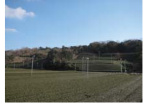
2 笠原水源周辺から南側に広がる山の斜面の茶畑