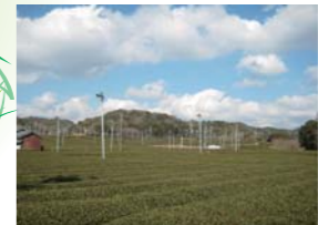
3 笠原茶産地看板周辺から北側の広大な茶畑