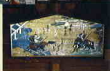
▼宇治川先陣争図(絵馬)