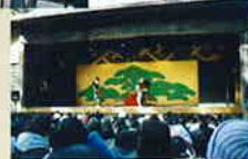
▼赤坂の舞台(平成13年2月完成式)