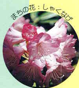
まちの花：しゃくばげ