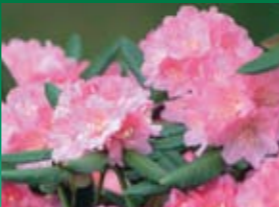
ツクシヤクナゲ (5月上旬) (ツツジ科) 3m~4mの常緑低木で1,000m以上の山地に生育している。 (特徴)33万本といわれる犬ヶ岳の自生地は国の天然記念物に指定されている。

この地図は、国土地理院長の承認を得て、同院発行の2万5千分の1地形図を複製したものである。(承認番号 平16九復 第281号) ※下記の時間は平均で精出ししていますので個人差によって誤差があります。