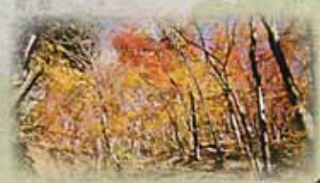
紅葉の残る松林への登路(坂本登山口方面より)