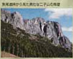
魚尾道峰から見た再建ニ子山の眺望

凡例 一般的な登山道 特別・前項に注意を要する難路 危険箇所 使いやすい箇所 駐車場 トイレ この地図の作成には、国土院の地形図を基に、同院発行の地形図(1:25,000)と、国土院の地形図(1:25,000)のデータを使用しました。また、この地図の作成には、国土院の地形図(1:25,000)のデータを使用しました。