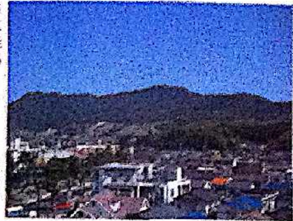
岩谷観音の岩路から広島市街、広島湾、江田島、能登島、御島、宮島を一望する 府中町の町並み越しに岩谷観音峰(左)と長安山(中央)を望む