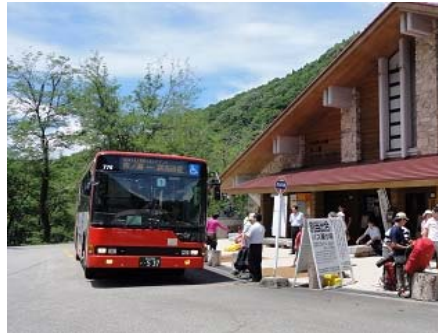
市ノ瀬バスのりば