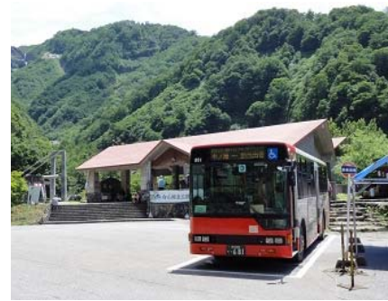
別当出合バスのりば