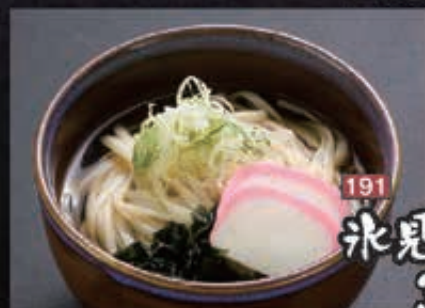
191 氷見細うどん 330円+税