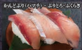
115 ぶり三種 330円+税