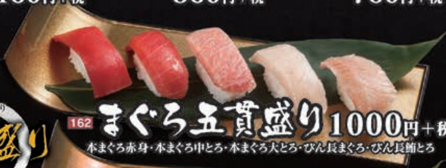
162 まぐろ五貫盛り 1000円+税 本まぐろ赤身・本まぐろ中とろ・本まぐろ大とろ・びん長まぐろ・びん長節とろ