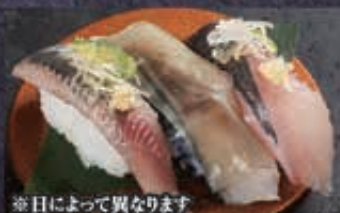
※日によって異なります 96 光物三種 280円+税