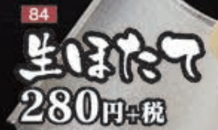
84 生ほたて 280円+税