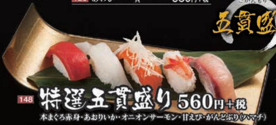
148 特選五貫盛り 560円+税 本まぐろ赤身・あおりいか・オニオンサーモン・甘えび・がんどぶり(ハマチ)