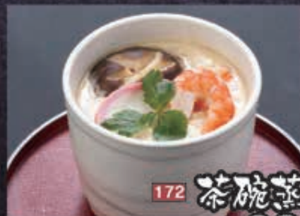
172 茶碗蒸し 280円+税