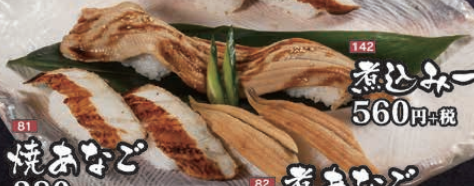
142 煮込み一本おなぎ 560円+税