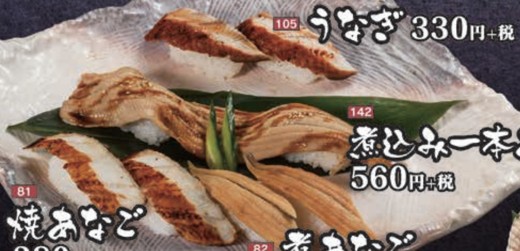
105 うなぎ 330円+税