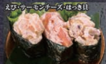
98 サラダ軍艦三種 280円+税