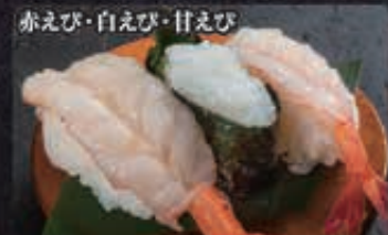
赤えび・白えび・甘えび 147 えび三種 560円+税