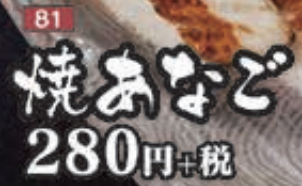
81 焼おなぎ 280円+税