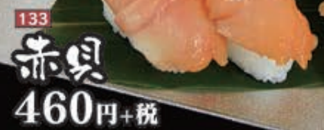
133 赤貝 460円+税