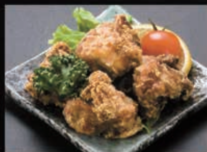
175 鶏唐揚げ 280円+税