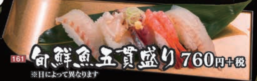
161 旬鮮魚五貫盛り 760円+税 ※日によって異なります