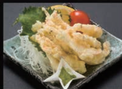
180 白えび天ぶら 380円+税