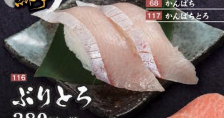
116 ぶりとろ 380円+税