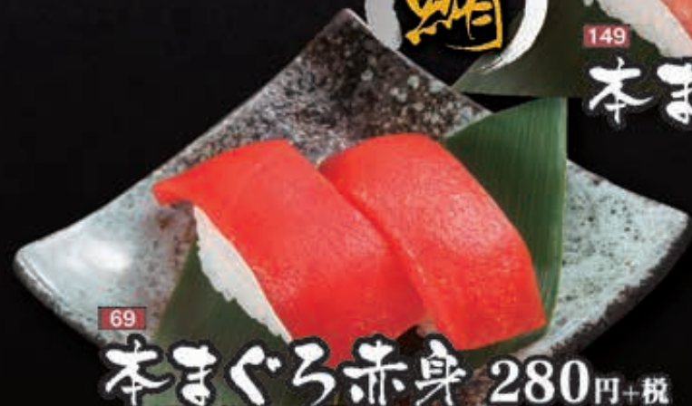
69 本まぐろ赤身 280円+税