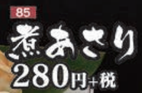
85 煮おさり 280円+税