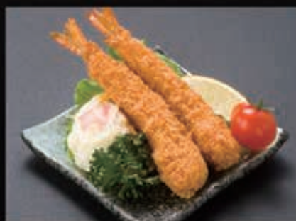
179 海老フライ (一品) 380円+税