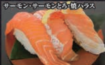
サーモン・サーモンとろ・焼ハラミ 138 サーモン三種 460円+税