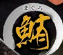
149 本まぐろとろ 660円+税