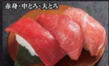
赤身・中とろ・大とろ 160 本まぐろ三種 760円+税