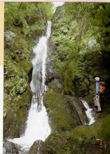
③ 大岳沢の大滝 25m