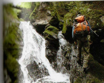
④ 3m滝は左から巻いた方がよい