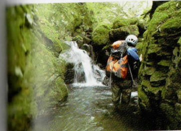
⑥ 水流沿いに小滝を越えていく