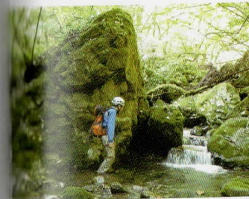
⑧ 三角岩。この辺りから倒木が多くなる