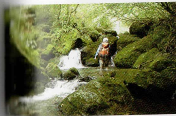
② 苔が厚く生えた溪流が続く