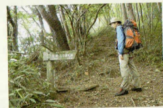
⑩ 馬頭刈尾根に出る