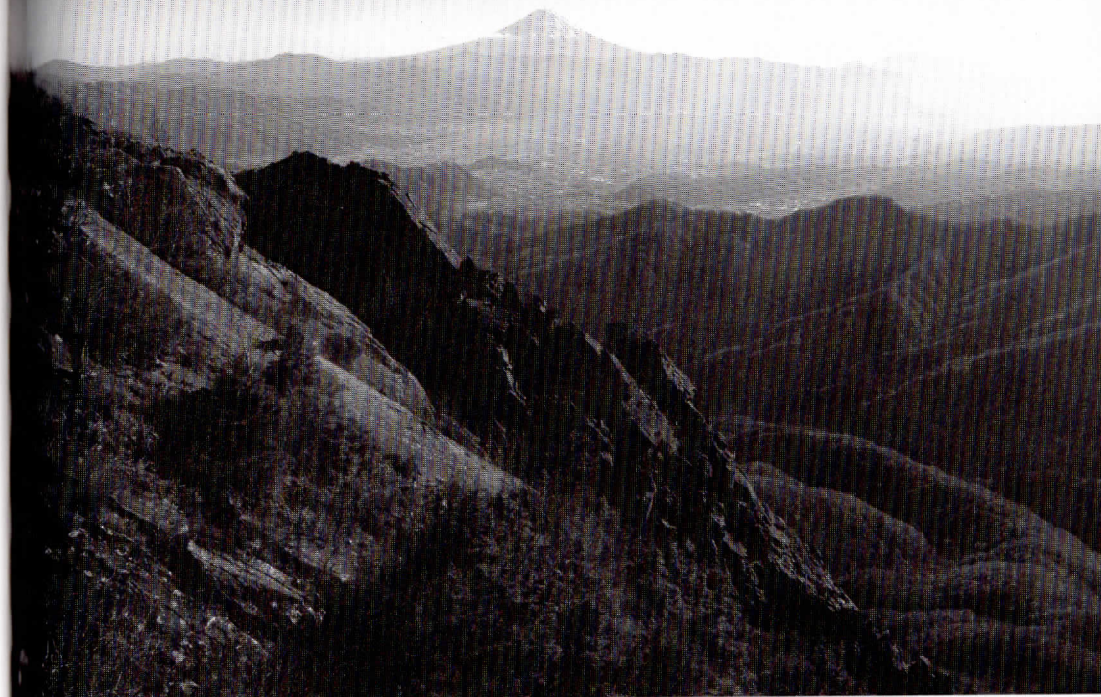
乾徳山頂上からの旗立岩中央稜と富士山